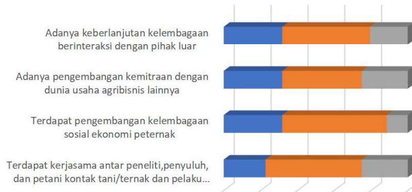
Gambar 3. Kelembagaan Penyuluhan dalam jejaring sosial

Untuk karakteristik kelembagaan penyuluhan dalam berjejaring seperti pada Gambar 3.